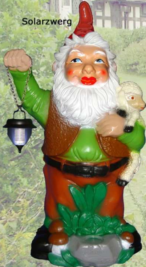
831 03 97 cm groß