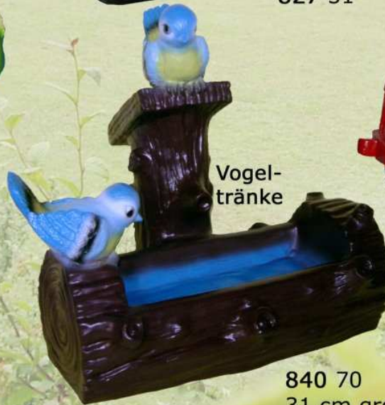
840 70 31 cm groß